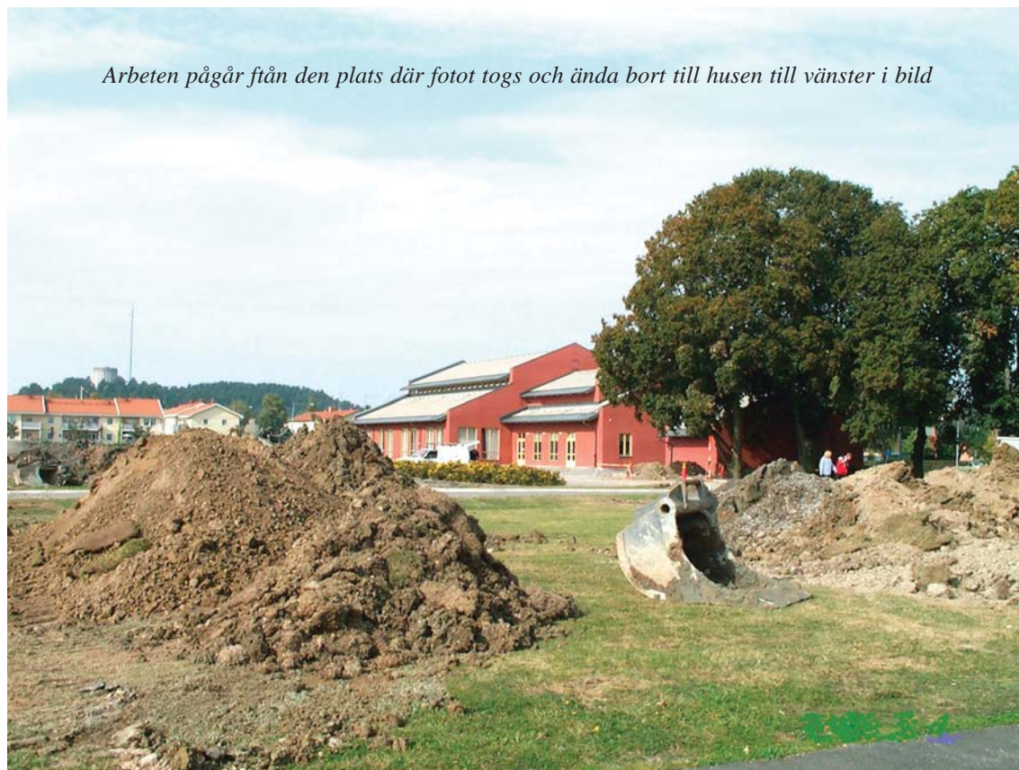
Arbeten pågår från den plats där fotot togs och ända bort till husen till vänster i bild