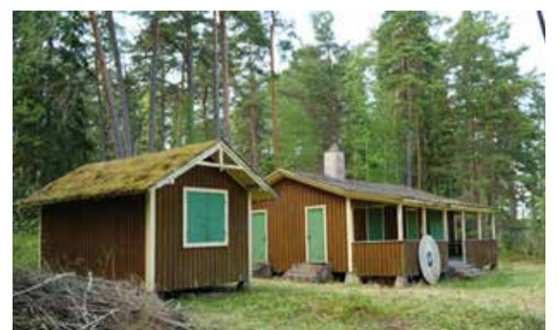
Skyttepaviljongen med den föreslagna boden till vänster.

Från Serveringsvillan/Galgbacken leder två stigar västerut. Vi tar den sydligare som leder upp till Ramunderbergets krön. Den bjuder på en storslagen utsikt över