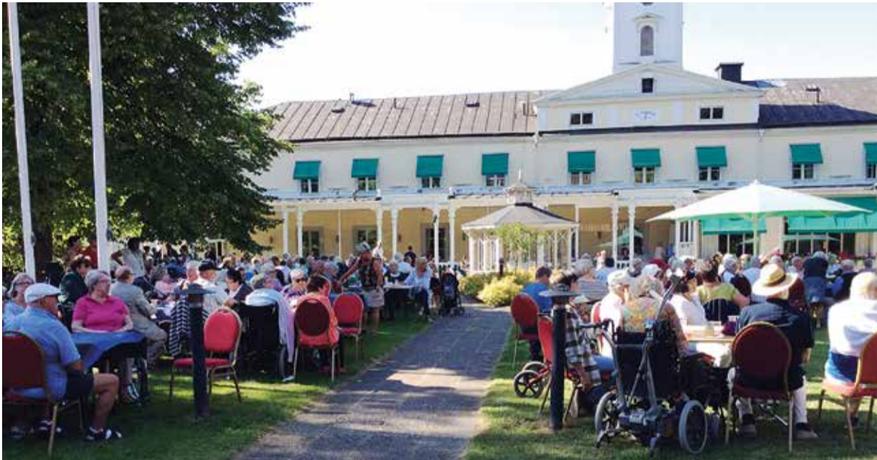
Tidigare år har festen varit vid Söderköpings Brunn. I år hålls evenemanget på Hagatorget.