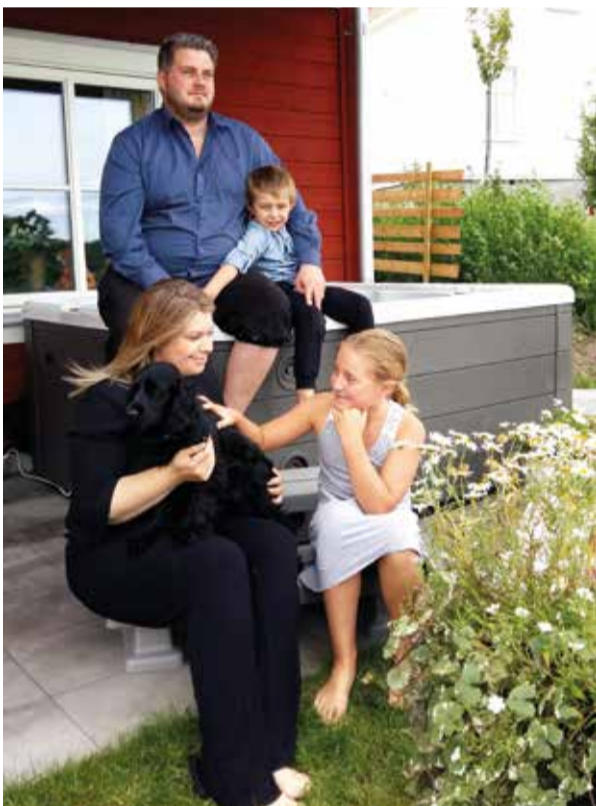
Familjen är samlad på uteplatsen med jacuzzi.