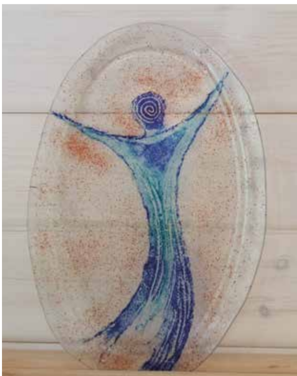
Vacker glaskonst i galleriet.