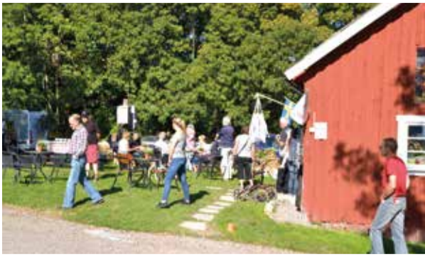
Östgotadagarna lockar många besökare till Vikbolandet.