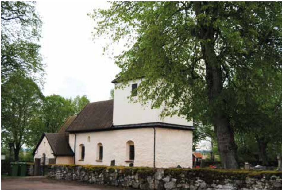
Kyrkan i Väversunda är från 1100-talet och står bredvid Berzelius födelseplats, den före detta prästgården.