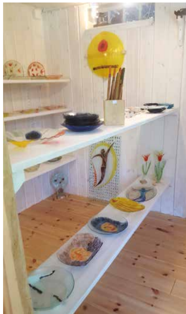
Vacker glaskonst inne i galleriet.