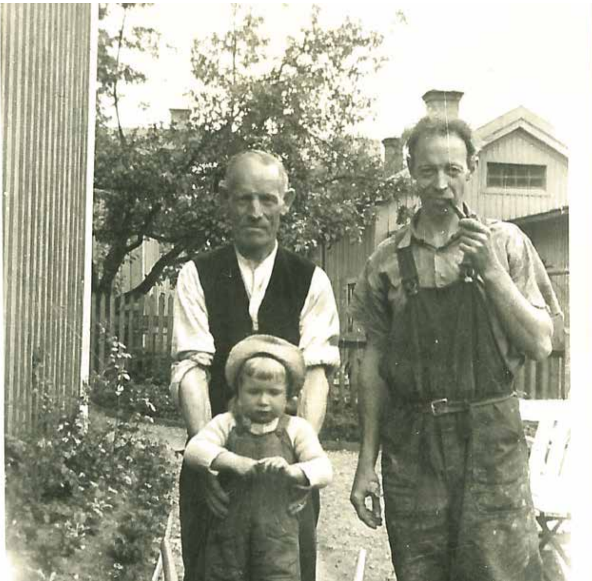
Farfar, jag och pappa år 1947.