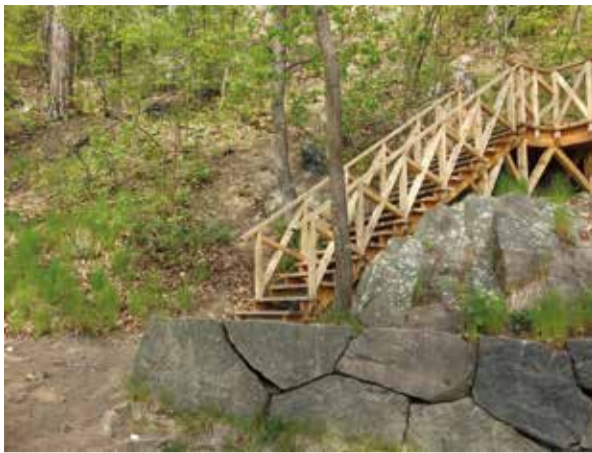
Den vackra trappan.

Vi går ner igen och tar oss över slussen. Jag avslutar vår vandring här. Hoppas ni tycker att det kunde vara fint att genomföra några av de här idéerna?