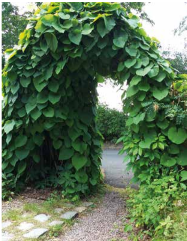
En vacker rosenportal vid trappans nederände känns inbjudande.

Om vi nu står nedanför trappan och innanför portalen så ser vi en stig till vänster. Vi följer den några meter upp och kommer då fram till Bergkällan. Där kan vi köpa buteljerat äkta Söderköpingsvatten. Kanske annat också? Brunnen är idag stängd och försedd med en tung järndörr. Vattnet sipprar fortfarande ut ur berget. Ännu en turistattraktion och kanske ett sommarjobb?