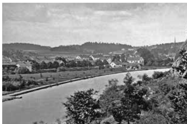
1870-talsvy från Ramunder.

Brunnsverksamheten var i gång långt innan de första spadtagen togs till kanalen. Stärkande promenader i Brunnsparken och närliggande naturområden var ett viktigt inslag i kurortsvistelsen. Vandringar på Ramunder med sin rena barrskogsluft framhölls som särskilt hälsobringande. Stigarna var väl upptrampade. Från brunnsområdet nådde man redan efter några hundra meter Ramunders fina och öppna sydostsluttning. Med kanalen tillkom ett "vattenhinder", som man dock snabbt vände till ett charmigt utflyktsinslag.