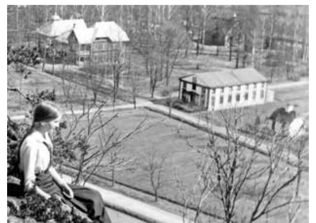
Brunnsvilla 3 och Stockholmshuset från Ramunder.

Kartan från slutet av 1880-talet visar tydligt området, som vi nu riktar vårt förstoringsglas mot. Ett väl utvecklat parkområde fanns intill Von Blocks Väg mellan Storån och kanalen. I parken ungefär där Brunnskyrkan senare byggdes låg ett lusthus. Runt parken fanns Parkhyddan (g), Stockholmshuset (i), Stora Lindhem och Lilla Lindhem. Sannantaget hade villorna ett 50-tal uthyrningsrum, som utgjorde komplement till kuranstaltens egna bostäder. 1893 tillkom Brunnslasarettet vid Storån och 1902-1904 de tre brunnsvillorna. Ståtliga Villa 3 låg invid Skepparevägen blott ett stenkast från färjeläget.