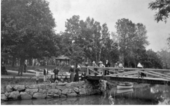
1870-/80-talet på lusthuset. Suckarnas bro och roddbåt.

Serveringsvillans läge på Ramunder är på kartan markerad med ett (v). Kring villan ses ett väl utbyggt nät av "Kurvvägar" (t). Dessa kompletterade de populära vägarna längs vattendragen. För den, som i stället ville ta en roddtur på Storån hade Brunnen roddbåtar för uthyrning.