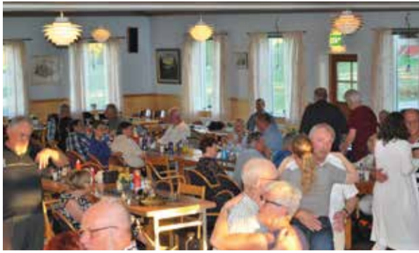
Några sitter vid kaffebordet en stund medan andra dansar för fullt, men alla har lika trevligt.

E-post: annons@lillatidningen.com Telefon: 0121-421 35