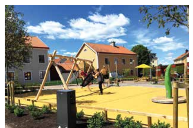
Full fart i gungan.