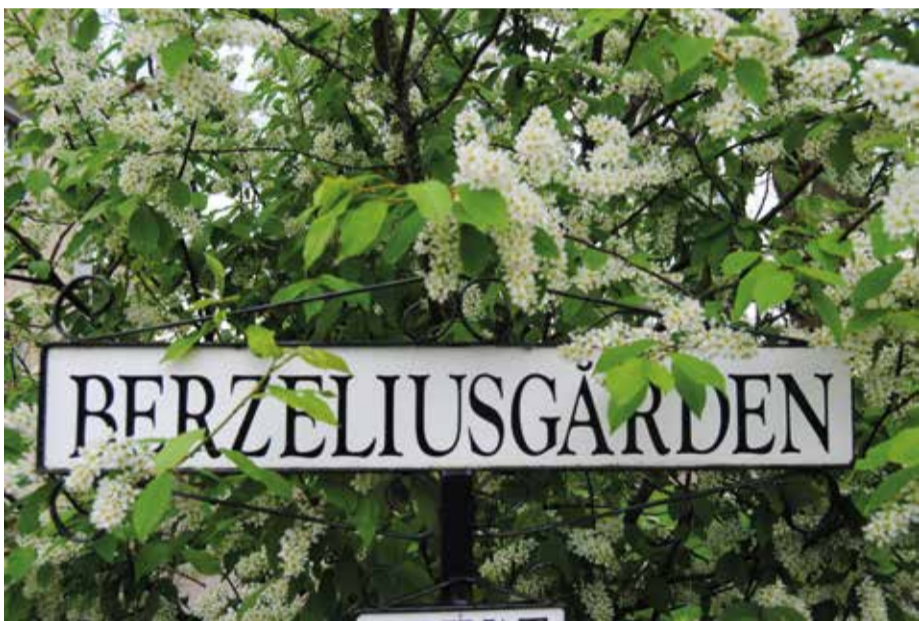
Berzeliusgården är inte så välkänd men däremot är kemistnamnet Berzelius känt på många håll utomlands.