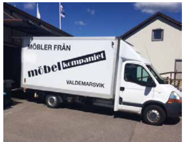
Möbelkompaniet levererar och monterar fritt inom en radie av 10 mil.