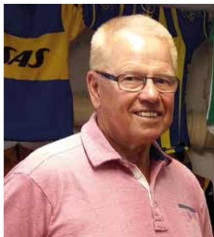
Curt driver cykelmuseum