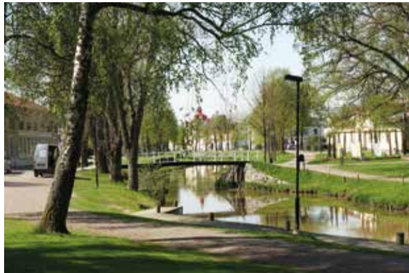
Bron över Kapellparken.

stämningsfulla musikaftnar. Kanske kan man ha en ute-teater någonstans i närheten av kapellet? På vår vänstra sida ligger det gamla K-märkta lite förfallna Lasarettssjukhuset, Bergaskolan och Tingshuset.