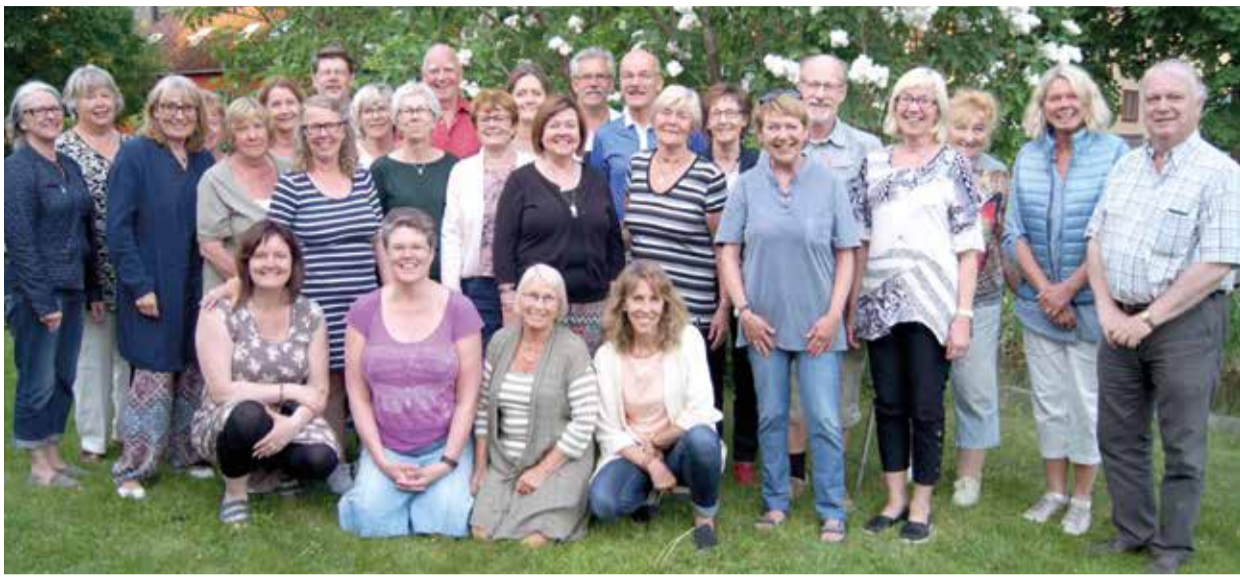
Från vår sommaravslutning 2016.