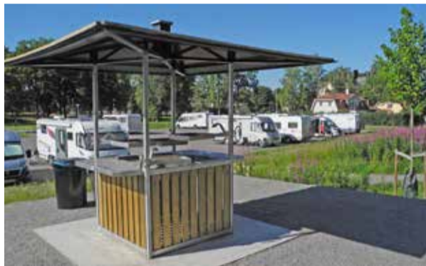
Husbilsparkeeringen med grillplats.

Granne med färjeläget ligger en stor husbilsparke-ring. Från grillplatsen på kanalbanken har husbilsfolket bästa utsiktsposition mot den nu berikade kanaltrafiken. Om lusten faller på har man dessutom nära till att företa "kanalfärd modell mindre"!