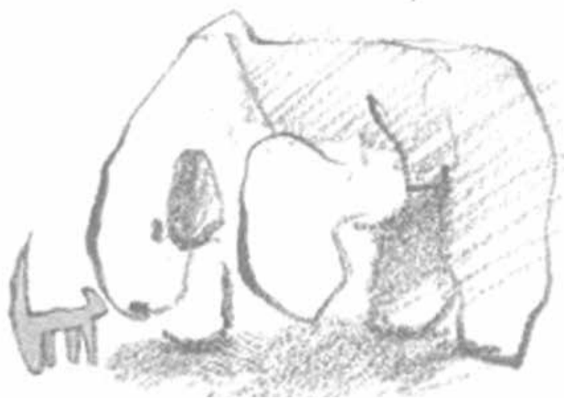
Illustration: Stellan Ekegren

”Där springer han nu omkring på kortklippt gräs i ett lätt kuperat landskap med hängande tunga och fladdrande öron och jagar små ulliga skuttande lamm.”