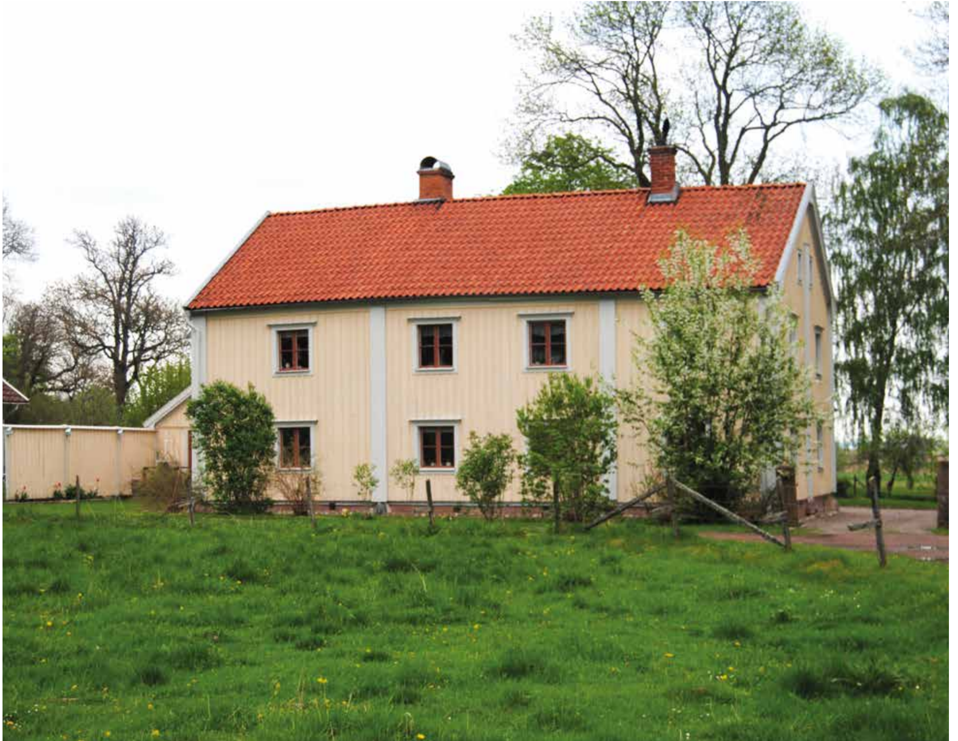
Berzelius födelsehus är idag privatbostad.

Världens mest kända östgöte? Ja, vem är det? Här är förmodligen svaret: