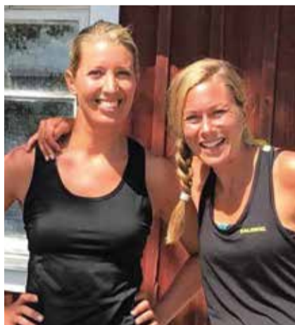
Frida på cykelsemester