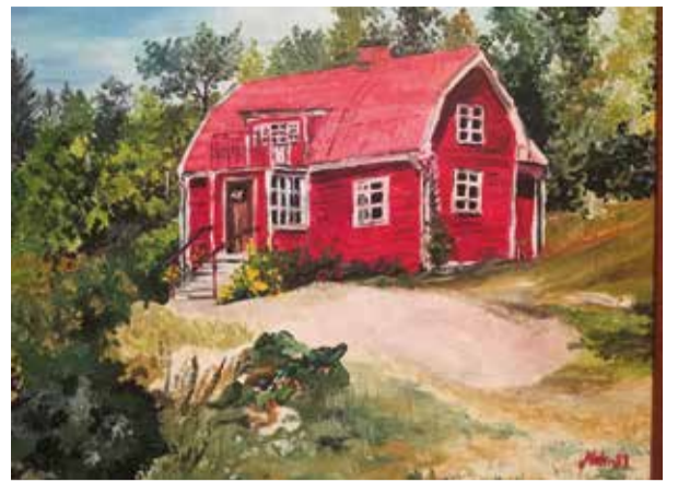
En målning föreställande Ängsbacken Övre.