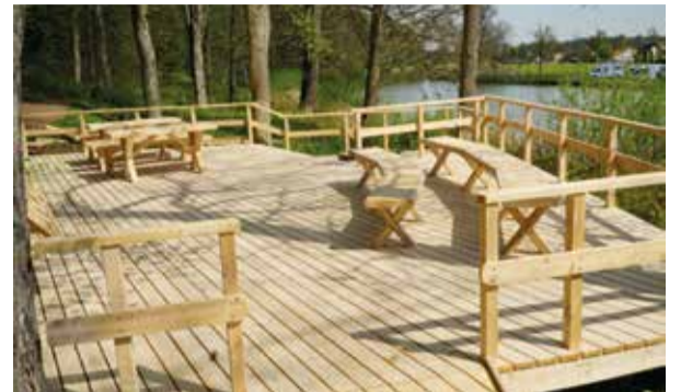
På motsatta stranden norra har man uppfört en informationsplattform på platsen för det gamla färjeläget.

En trappa ansluter vid norra färjeläget. Vi tar den och kommer upp till det som förr var Galgbacken. Kring förra sekelskiftet ersattes galgen av en snickarglad serveringsvillan. Ett underbart mål för en liten utflykt eller promenad! Tänk om man kunde få till en sådan igen?