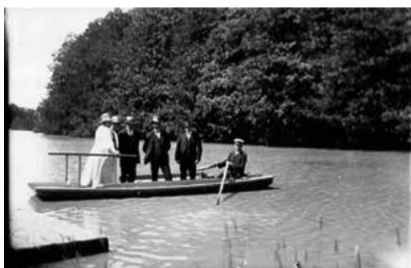
Den gamla roddfärjan.