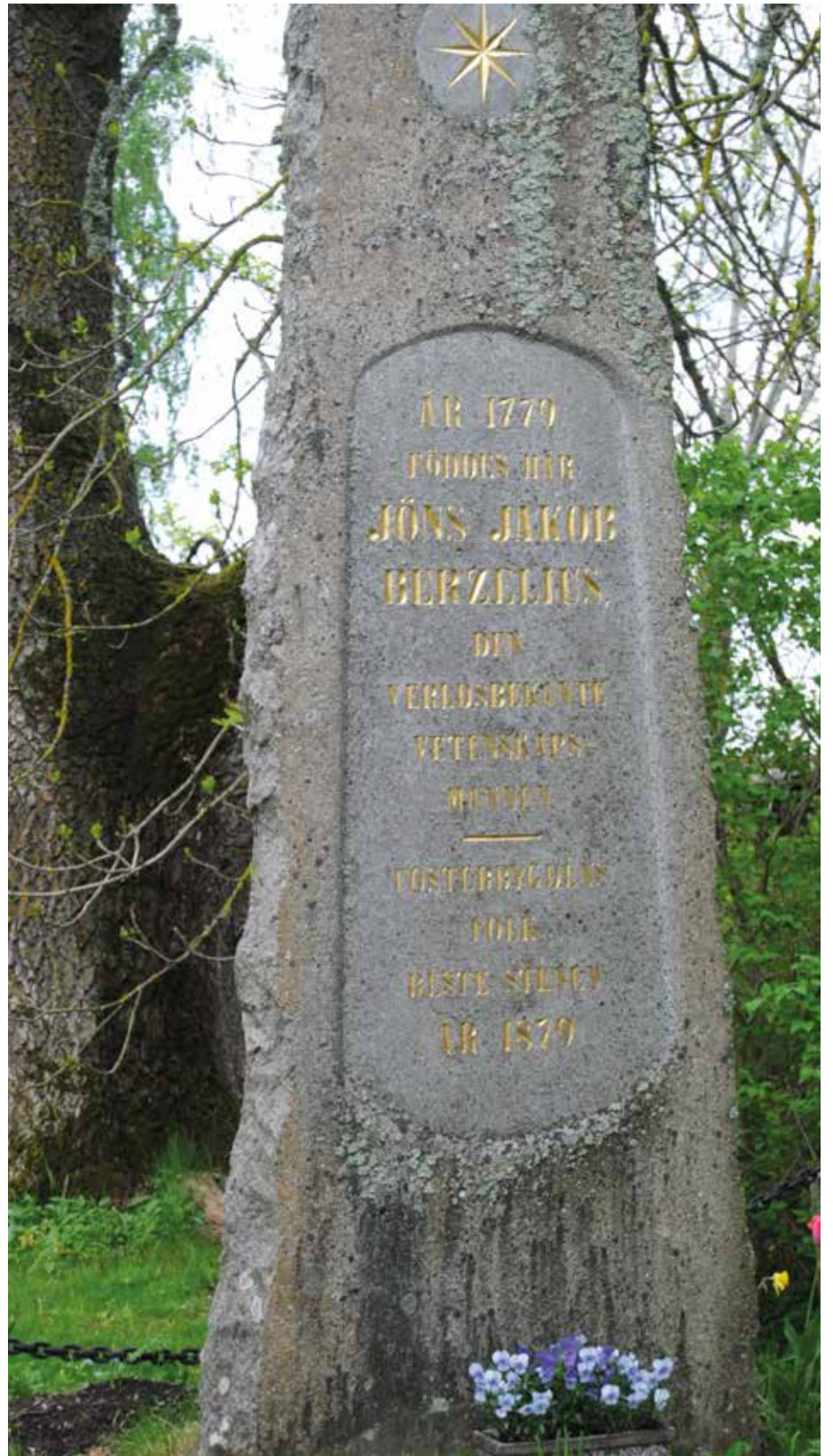
År 1879, alltså 100 år efter Berzelius födelse, restes minnesstenen intill födelsehemmet i Väversunda.

det moderna kemiska symbol- och teckensystemet (ex. H för väte och O för syre), så när vi till exempel använder formlerna H_2O och CO_2 så är det på grund av Berzelius. Han gav därmed kemin ett internationellt språk. Han bidrog till den vetenskapliga grunden för den moderna atomläran, inte minst genom att forska fram grundämnenas proportioner i kemiska föreningar. Han upptäckte flera grundämnen, som nämnts kisel men även exempelvis selen. Han bidrog också till upptäckterna av grundämnena torium och cerium. Han förbättrade tekniken i de kemiska laboratorerna med bl.a. gummi och filterpapper samt inte minst elektrolysen (elektrisk sönderdelning av kemiska föreningar). Han skapade de idag allmänt kända och använda begreppen katalys, protein och halogen. Han namngav grundämnet vanadin (efter Vanadis, ett namn på gudinnan Freja). – och som sagt han utvecklade den kolsyrade drycken med olika smaker även om troligen västgöten Torbern Bergman var den förste att kolsyra vatten.