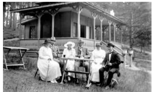
Serveringsvillan. Nedanför låg en serveringsterrass och till höger stod musikkapellet.

En trappa ansluter vid norra färjeläget. Vi tar den och kommer upp till det som förr var Galgbacken. Kring förra sekelskiftet ersattes galgen av en snickarglad serveringsvillan. Ett underbart mål för en liten utflykt eller promenad! Tänk om man kunde få till en sådan igen?