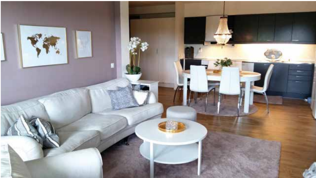
Öppen planslösning mellan kök och vardagsrum.