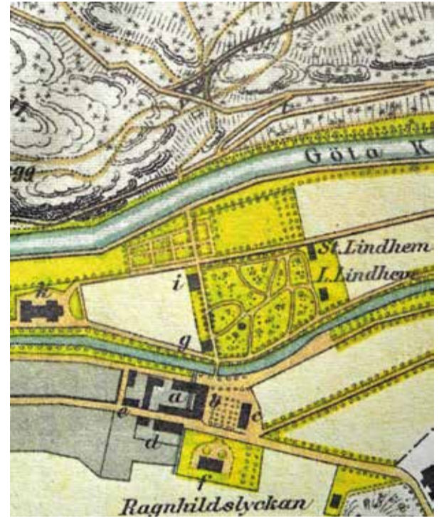
Utsnitt från 1880-talskarta.

På 1870-talets vy ser man till vänster en stor brygga belägen mitt för Brunnsområdet och Von Blocks Väg. Så småningom ersattes den av en mindre brygga vid det vi kallar färjeläget. Brunnsparken nådde på den tiden ända upp till kanalen. Utmed kanalbanken fanns en rad bänkar med sittmöjligheter för väntande. Troligen hade bryggan tidigt en roll för Brunns kommunikationer med omvärlden via kanalen. Ångfartyg stannade för att lämna av och ta ombord brunns-gäster och för varutransporter? Ekan, som ses på bilden, var väl till för att nå närmaste vägen till Ramunder? På Ramundersidan ser man en angoringsplats med en liten stuga, bänkar samt upptrampade stigar.