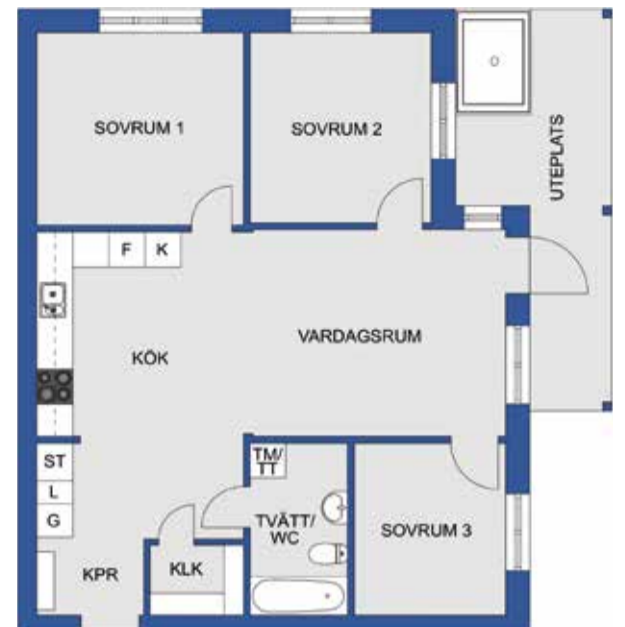
Planskiss över lägenheten.