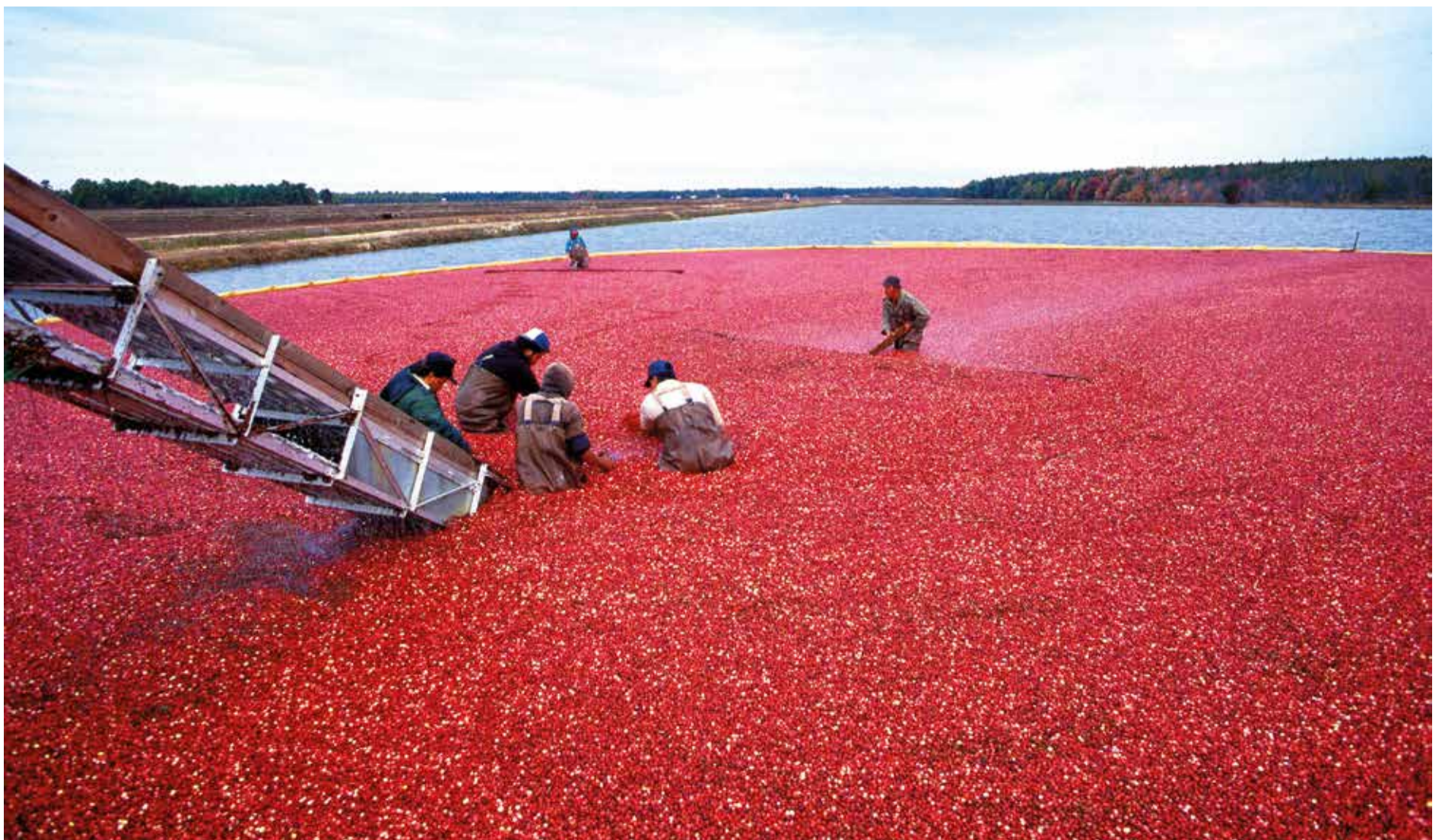
Så här ser det ut idag, när man skördar Tranbär i Nordamerika.

Och jag som trodde att det kanske var en här av mexikanska jobbare som gick hukade i en omöjlig arbetsställning och slet med de glesa bären till en mager lön.