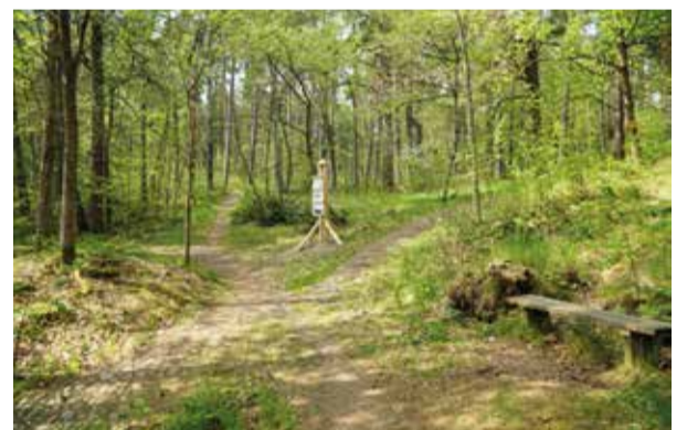
Galgbacken och platsen där Serveringsvillan låg.

Ett förslag är att man flyttar dit boden som nu står vid skyttepaviljongen på Ramunderbergets norra sida. Kanske är det bättre att bygga en ny? Det är svårt att överträffa den gamla förebilden men snickarna som byggde den långa trätrappan upp på berget kan nog åstadkomma ett nytt under! Skolungdomar kunde sköta serveringen och något av caféerna i stan kan stå för leveranserna. Serveringsterrasserna finns kvar. Dock lite igenvuxna men det går enkelt att röja upp dem. Musikkapellets plats kan anas till höger i bilden.