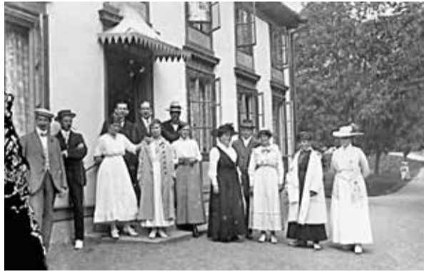
Gäster utanför Stockholmshuset.

Från Slottet är det 150 meters promenad på den grusade stigen, med det ståtliga namnet Von Blocks Väg, innan man når bryggan. Vännerna, som bor i Stockholmshuset 50 meter från kanalen är redan på plats. En liten kö av utflyktssugna har bildats på kanalbanken. Från närbelägna Brunnsvillan 3 ses ytterligare brunnsgäster på väg. Det tycks vara flera, som kommit på samma idé! Väntan på färjan förflyter med glatt samspråk mellan brunnsgästerna, som kommer från många håll i Sverige men också våra grannländer. Ingen känner stress. Man har ingen tid att passa och musikunderhållningen börjar först om några timmar.