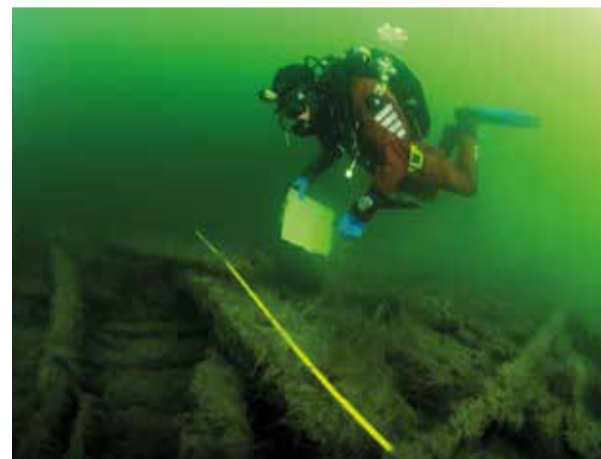
Regalskeppet Riksäpplet.