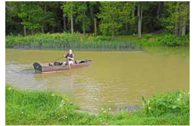
Arrangerad bild med ekan från Färjestugan.

dan här för att försiktigt och på egen risk korsa kanalen?