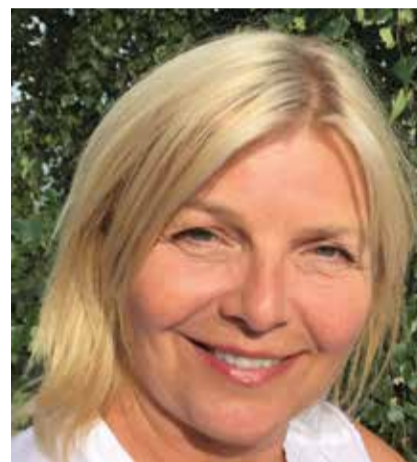
Rose skriver om lingon och mjölon