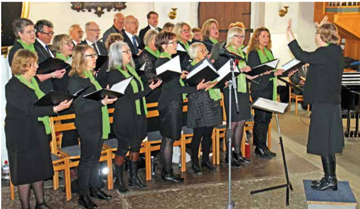
S:t Laurentii kyrka påsken 2016.