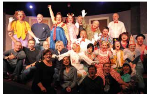
Hela ensemblen i en tidigare föreställning.

Tidigare Ljunga-bo. Har skrivit boken Gryningspyromanen: en berättelse om hämnd som handlar om en känd mordbrännare.