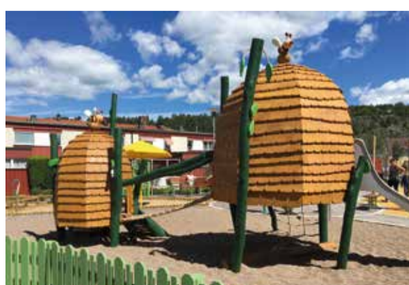
Nya lekplatsen vid Hospitalsgatan.