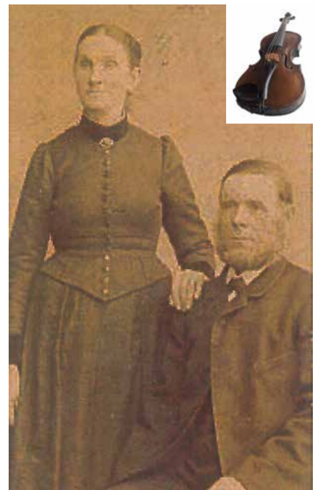
"OlleWassa" och Hilma. Uppe till höger ser ni fiolen.

Och visst har det satt sina spår i släkten för musikaliteten är det inget fel på, även om den inte var något jag fick ära. Jag fick nog bondegenen.