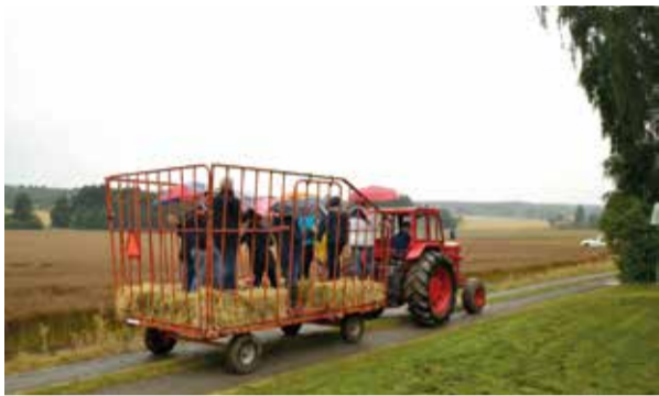
Åka traktor och vagn är en populär aktivitet.