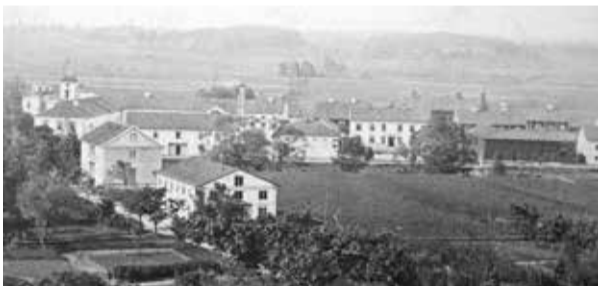
Mot brunnsområdet från Ramunder på 1870-talet.

Men i en broschyr från 1892 för Söderköpings Brunn och Bad läser vi att Stockholmshuset har 27 rum, vilka hyrs ut för 3-5,50 kr/vecka. Av broschyrens karta från 1880-talet framgår husets läge. Alltså måste huset redan ha varit på plats i brunnsområdet när 1897 års Stockholmsutställning gick av stapeln! Detta bekräftar också av nedanstående bild tagen mot området senast på 1870-talet.