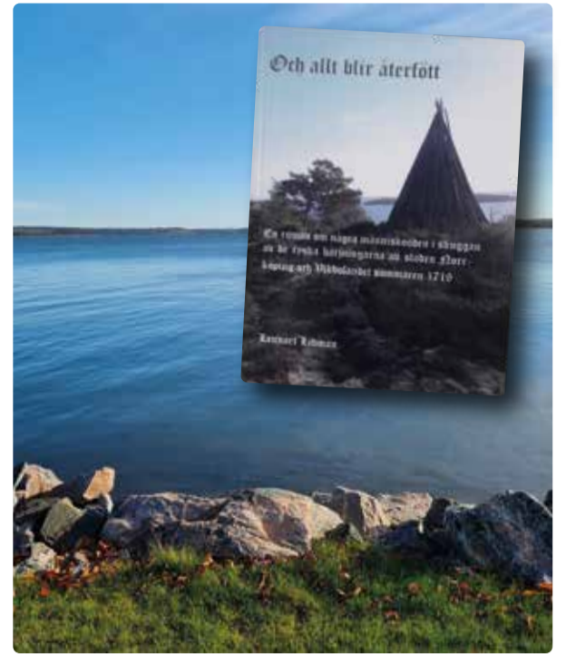
I Bråviken mellan Vikbolandet och Kolmården seglade den ryska flottan in.