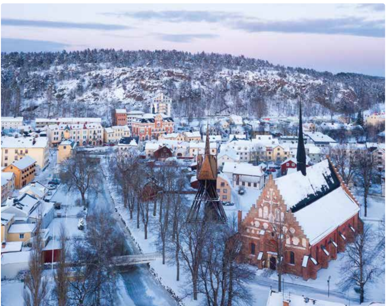
Söderköping med Ramunderberget i bakgrunden.