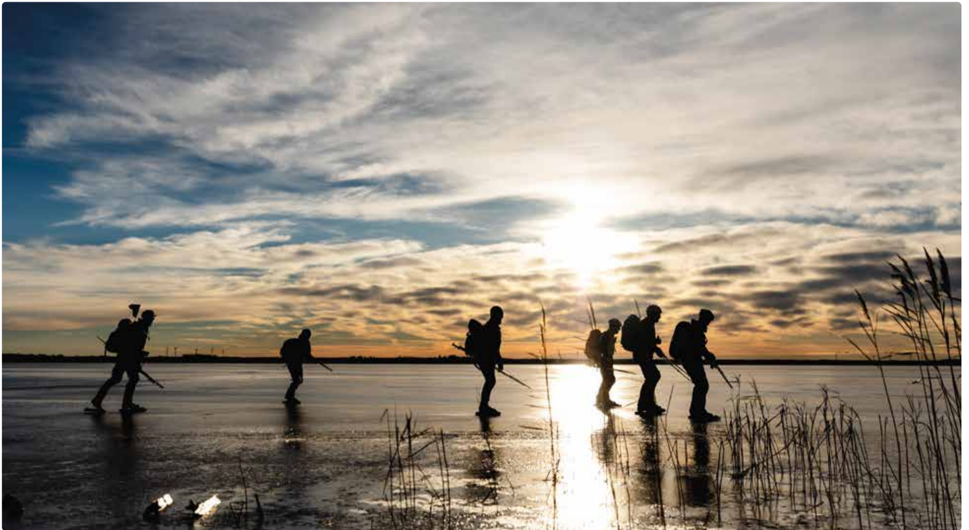
Åk långfärdsskridskor om vädret tillåter.

”Söderköping erbjuder många idrotts- och friluftslivsaktiviteter. Allt ifrån skid- och skridskoåkning till vandring i vinterlandskap med stopp för grillning.”