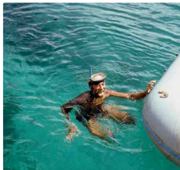
Snorkling i tropiskt vatten.