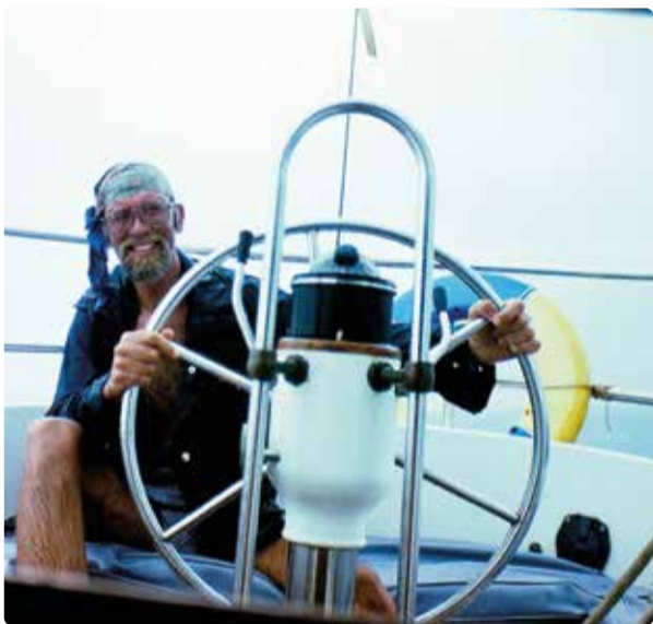
Ekvatorn - regn, regn, regn.