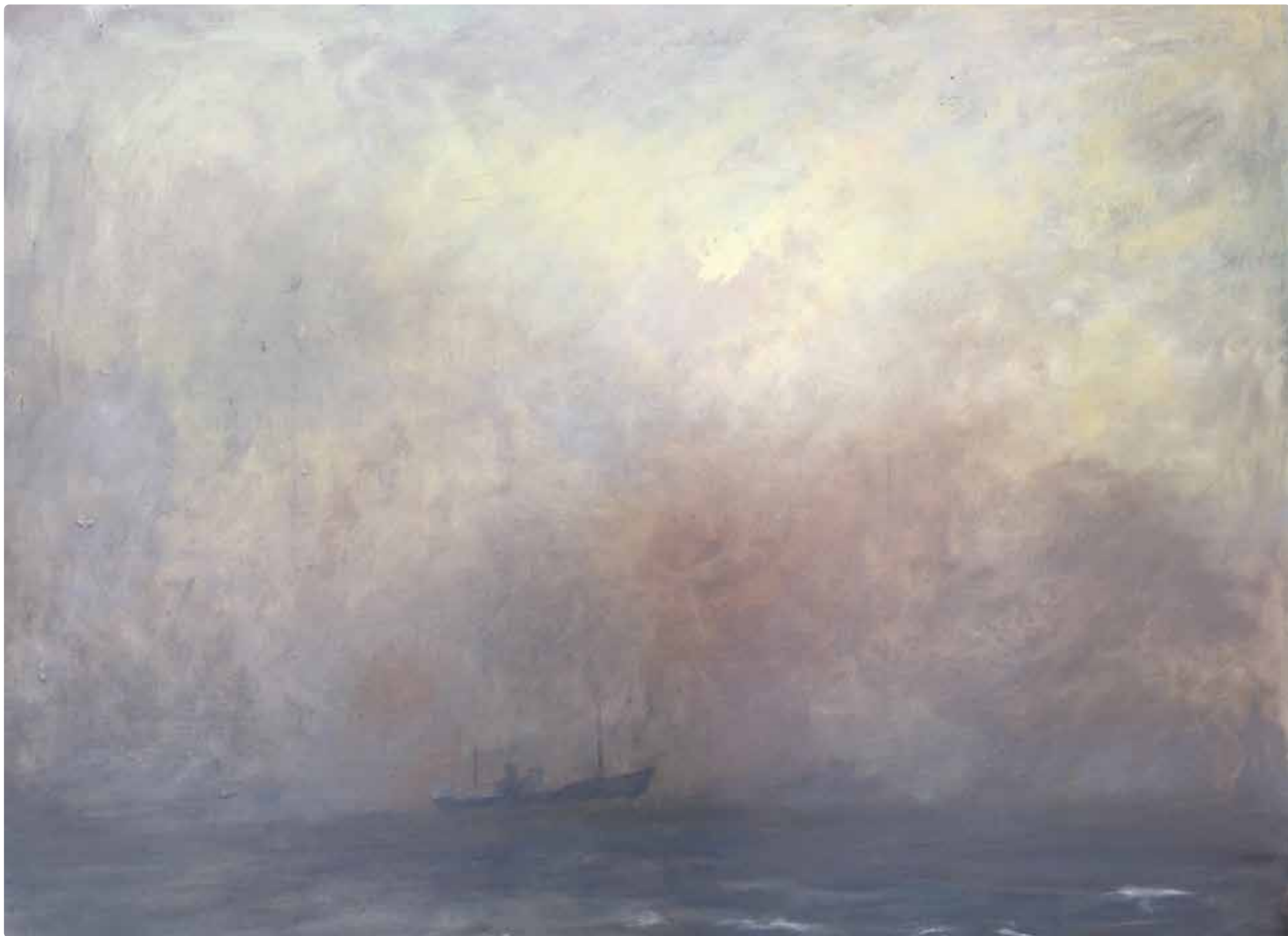
När dimman lättar.