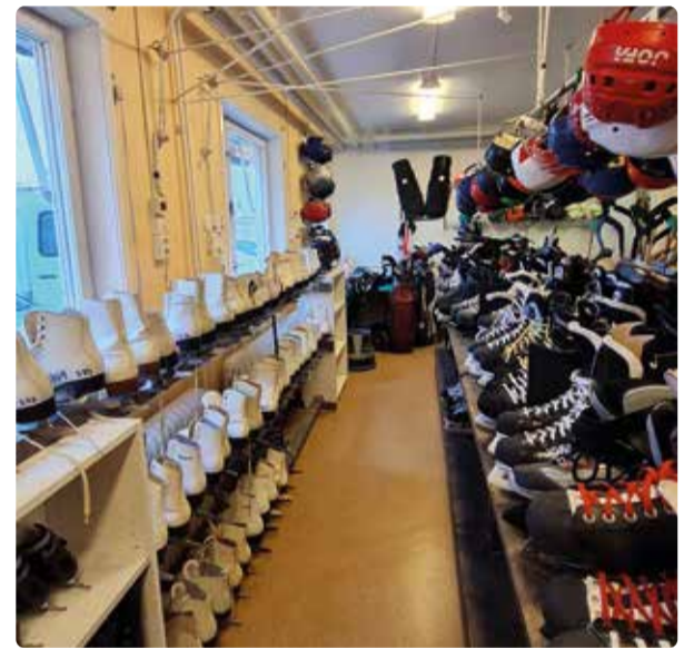
Ta chansen att låna hjälm och skridskor i vinter.

”- Vi har ungefär 1 300 produkter i lager. Här finns det mesta finns för sport och fritid i olika storlekar. Det har varit en stor tillströmning av begagnad utrustning som nu kan återanvändas i stället för att kastas. Sortimentet blev mer omfattande än vi kunnat drömma om. Det enda vi köpt in själva är några fotbollar.”