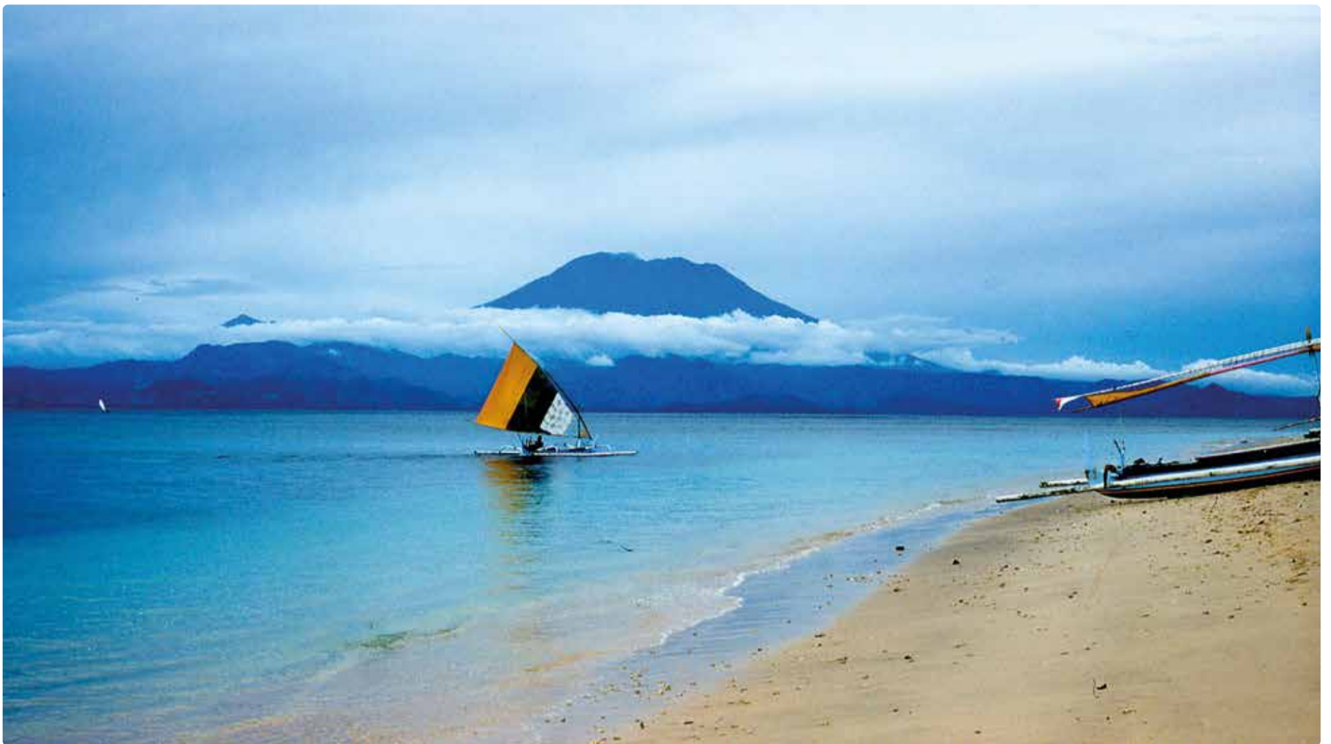
Vulkanen Nagung Agung på Bali.