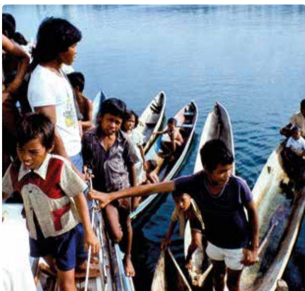
Alla vill komma ombord.