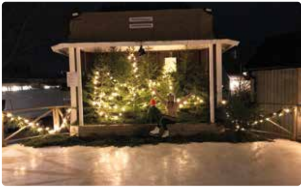
Isbanan vid Kanalhamnen.