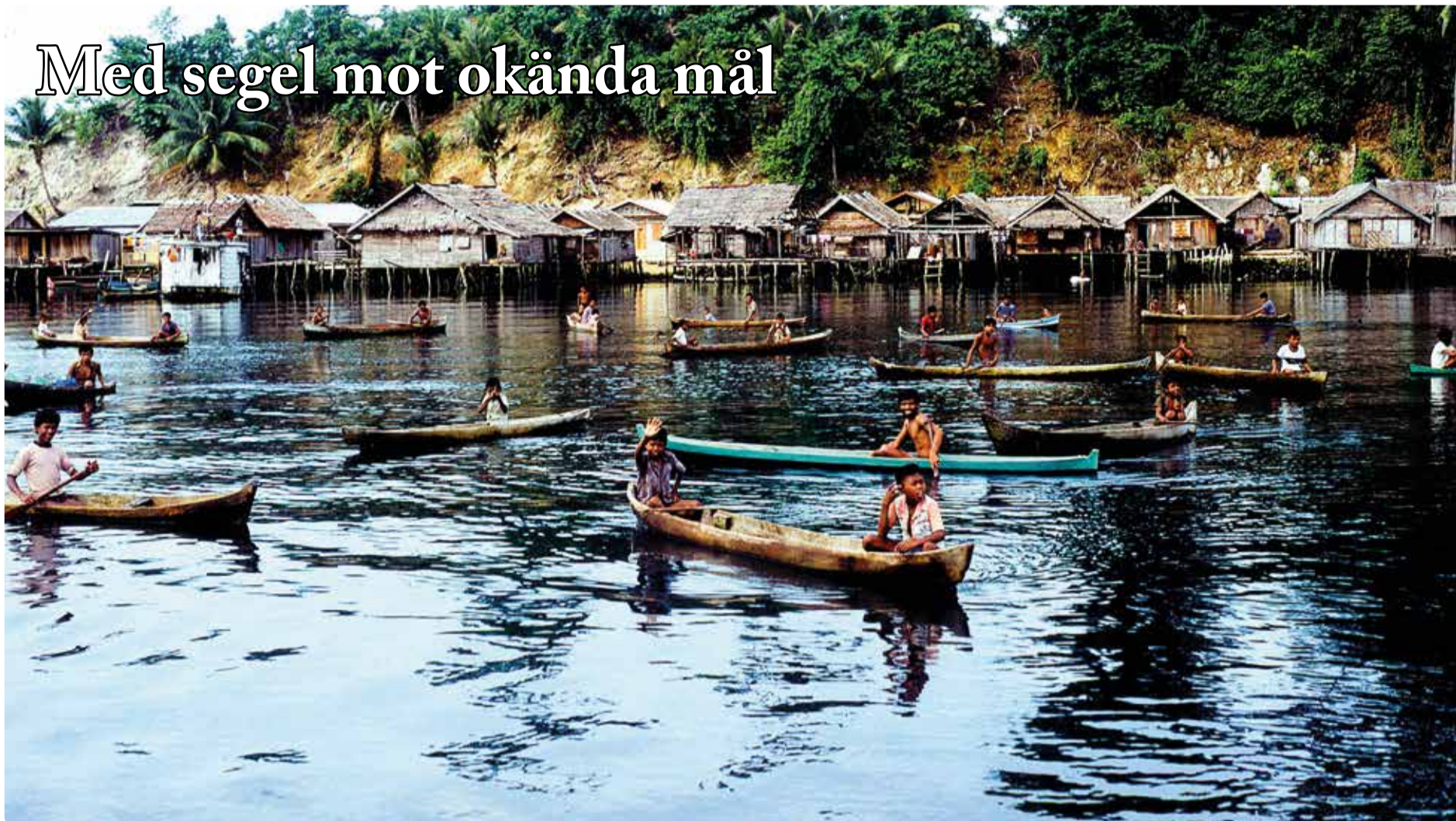
Avskedet - Viva la Dutch.