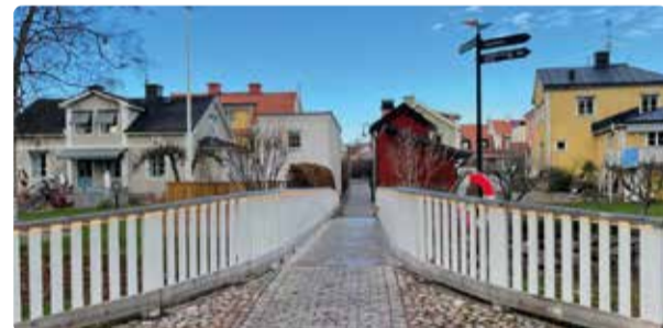
Här startar nyckeljakt genom Söderköping.