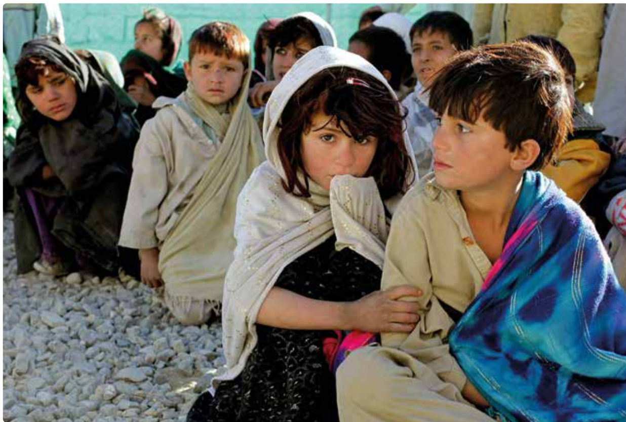
Många flyktingar firar inte jul, men är värda vår välvilja och generositet.