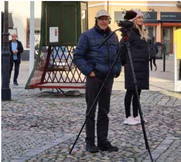
Sune syns ofta med kameran på gator och torg.

”- Det många som kommer fram och tycker det är roligt att jag filmar. Om jag inte har kameran med mig så frågar de var jag har den.”