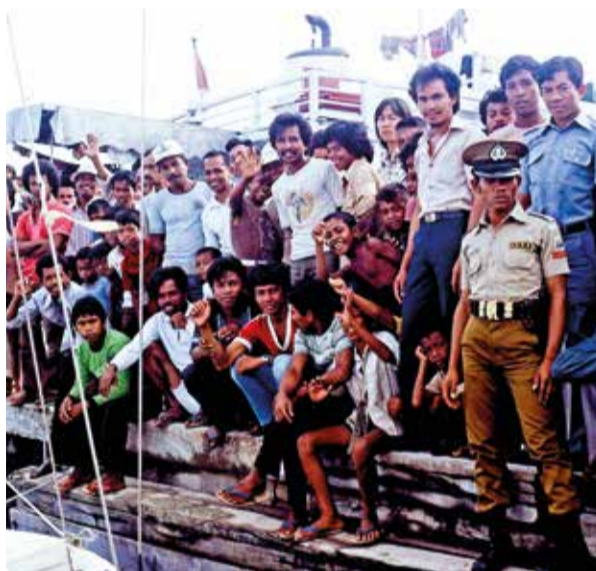
Uttittade i Bau Bau