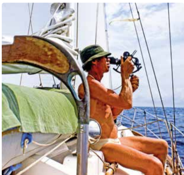
Navigering med sextant.