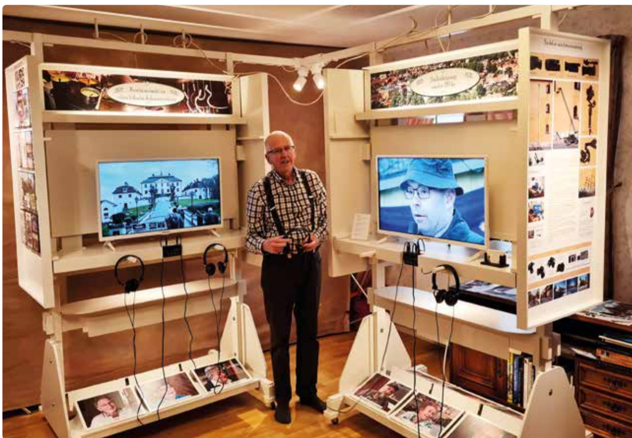
Sune vid visningsmontrarna.